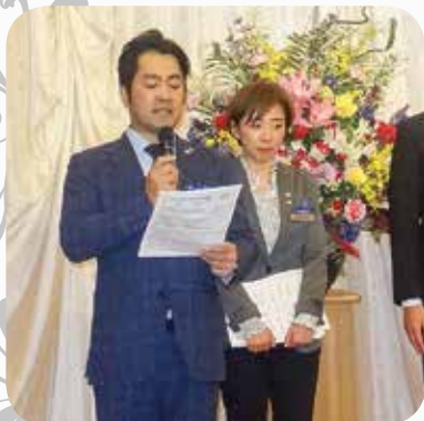
平成30年度 委員会計画発表