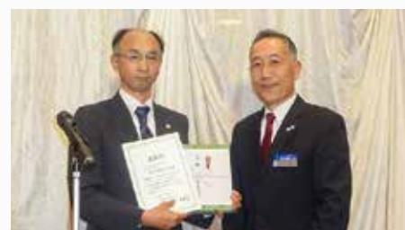
平成29年度 モーニングセミナー出席率単会表彰 第3位 奥州市倫理法人会