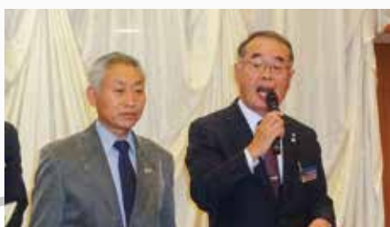
平成30年度 委員会計画発表