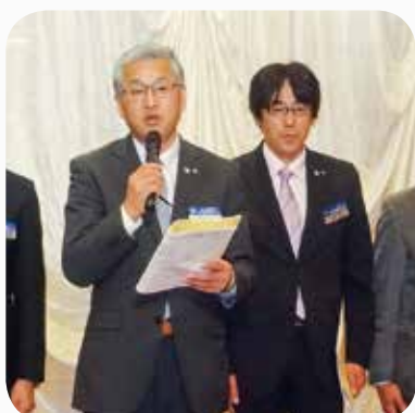
平成30年度 委員会計画発表