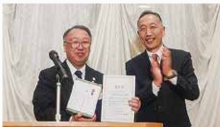
平成29年度 モーニングセミナー出席率単会表彰 第1位 久慈市準倫理法人会