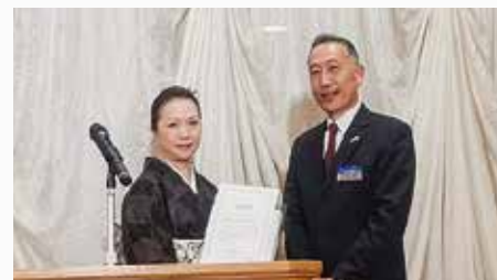
平成29年度 モーニングセミナー出席率単会表彰 第2位 盛岡みなみ倫理法人会