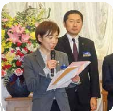
平成30年度 委員会計画発表