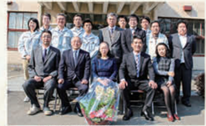
H28 退職者送別集合写真