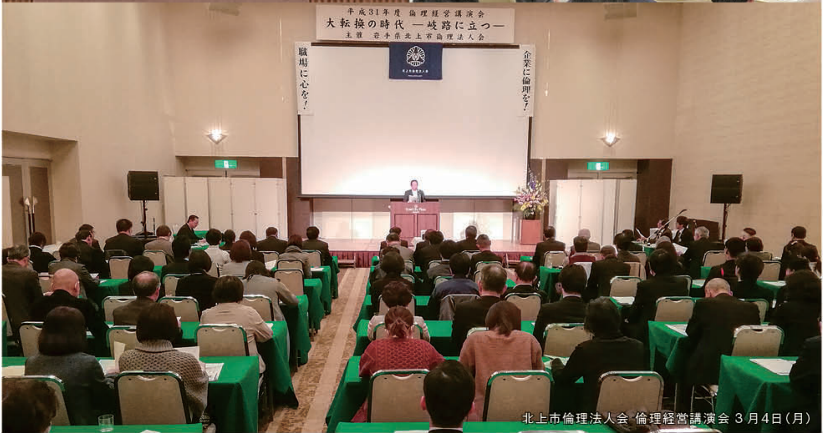
北上市倫理法人会 倫理経営講演会 3月4日(月)