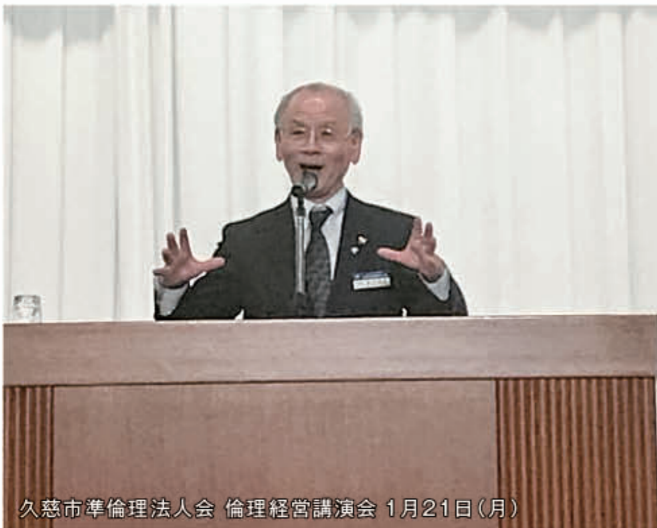
久慈市準倫理法人会 倫理経営講演会 1月21日(月)