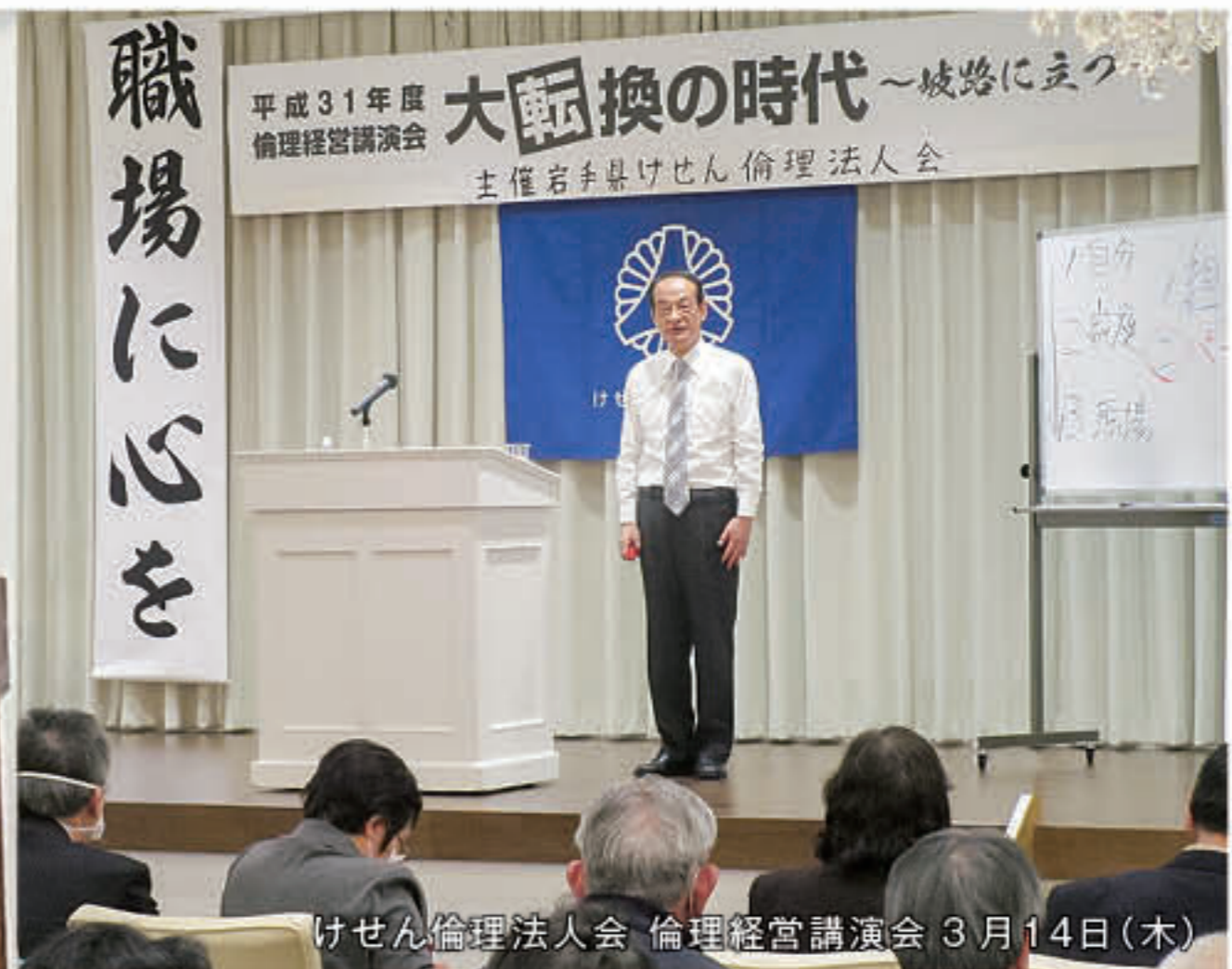
けせん倫理法人会 倫理経営講演会 3月14日(木)