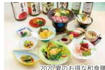
2020夏のお得な和食膳