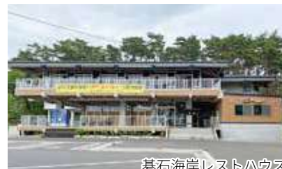
碓石海岸レストハウス