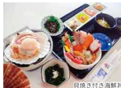
貝焼き付き海鮮丼