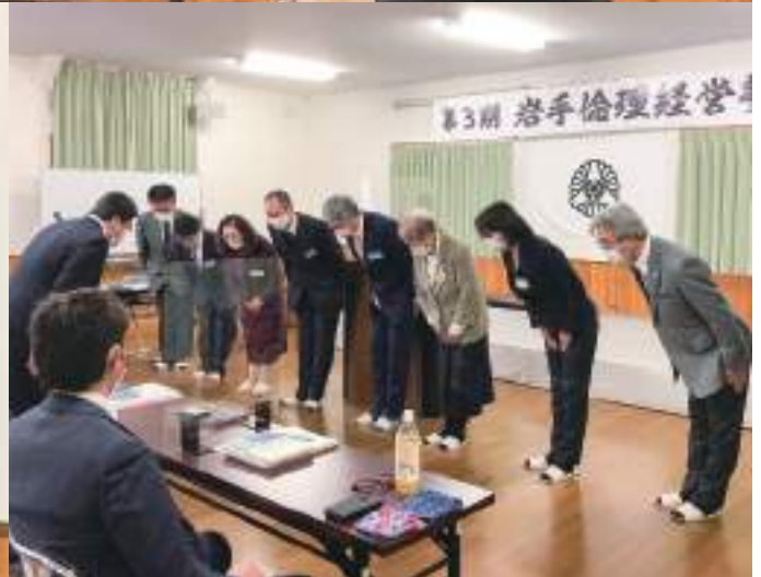
第3期 岩手倫理経営塾 開講式