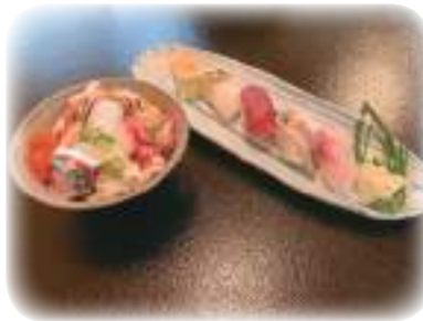
三陸・海鮮ミニ丼セット