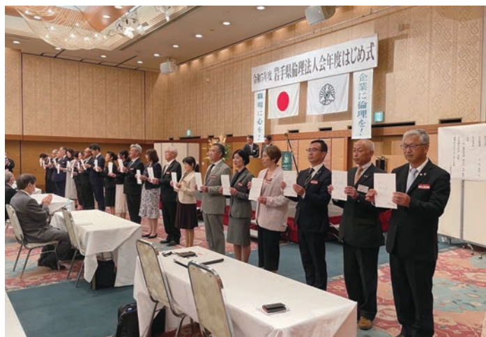
令和5年度岩手県倫理法人会「年度はじめ式」