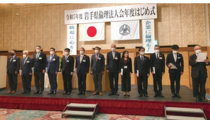
13単会 会長決意表明