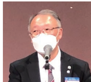
令和4年度 日當和孝事務長