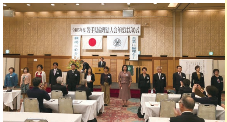
単会への辞令交付