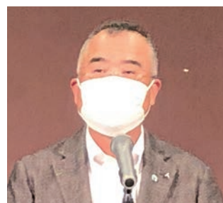
令和5年度 菊池奨事務長