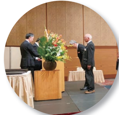
県役員・委員長・副委員長へ辞令交付