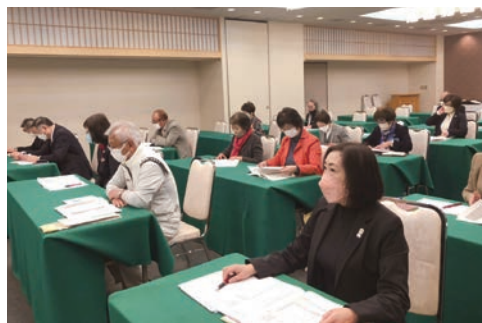
モーニングセミナーおもてなし研修会

このセミナーは、モーニングセミナーを活性化させたいということで開催。最初の1時間はモーニングセミナーの取り組みについて説明をいただき、その後は実習形式で行われました。