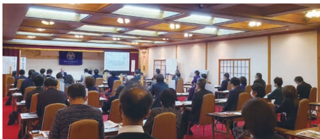
経営者50人モーニングセミナー