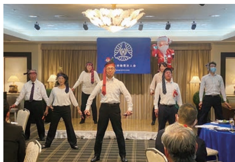
盛岡市スペシャルダンサーズ