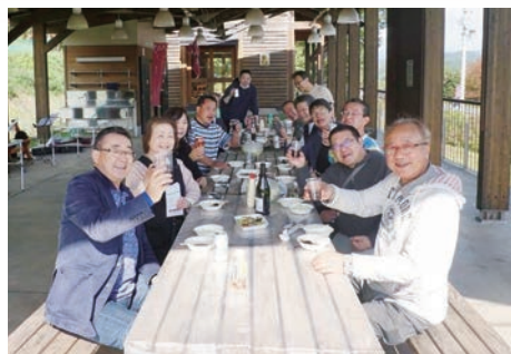
バーベキュー大会