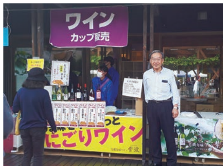
自園自醸ワイン紫波