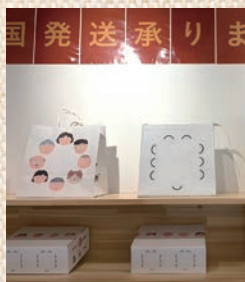
お土産・地方発送も充実