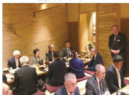
宮城県倫理法人会キャリア委員会との交流会