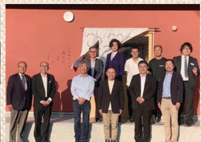
第4回広報委員会開催！