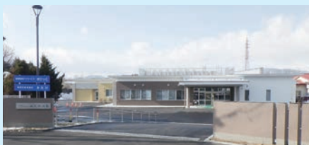
みたけの社 (中亀建設施工)